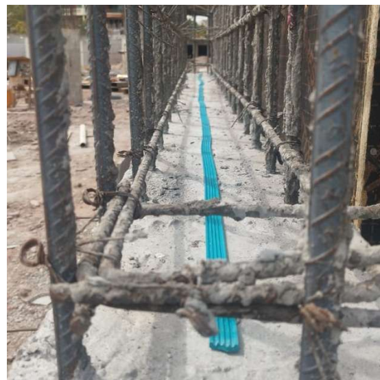
Colocación en junta fría