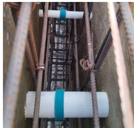
Colocación en pasos de tubería